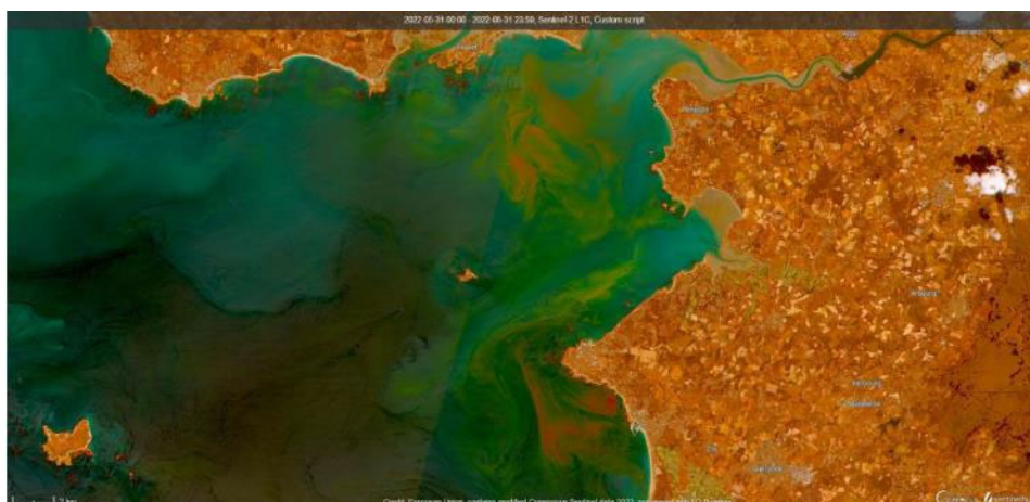
Image Sentinel-2 en fausses couleurs de la baie de Vilaine le 31 mai 2022 , Source : Pierre Gernez, ISOMer, Nantes Université.