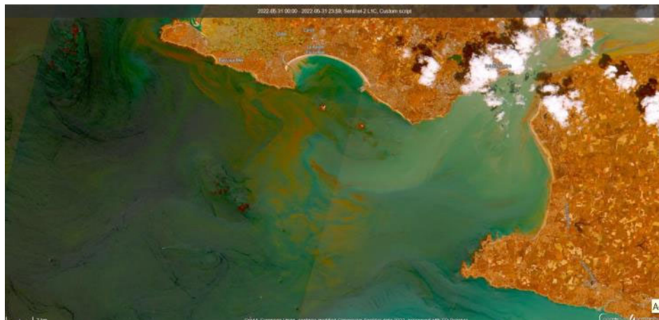
Image Sentinel-2 en fausses couleurs en sortie d'estuaire de Loire le 31 mai 2022 , Source : Pierre Gernez, ISOMer, Nantes Université.